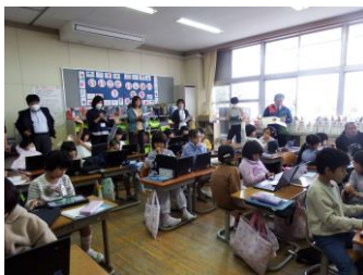
1年生；引き算の授業

学校でも、朝の「学びタイム」に計算力アップの曜日を設定したり、個別指導をしたり、計算ドリルに2回以上取り組ませたりしていますが、まだまだ不十分です。どの教科でも同じですが、特に算数の学習の定着には、復習が必要不可欠です。徹底的に復習をして、計算問題に慣れることが大切です。是非、 1日10分 学校の計算ドリルやプリント等から子どもに問題を出して、 繰り返し解かせてください 。そして、できたら必ず褒めてください。3年生以上の子どもには、かけ算九九が完璧かどうか試してみてください。ご協力をお願いいたします。