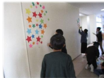
【廊下に★の飾り付け】