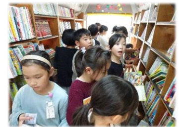
【移動図書館での本の貸し出し】