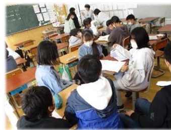
【5, 6年生による話し合い】

当日は、保護者や向ヶ丘保育園の年長児を招待する予定です。星の子フェスティバルが、子どもたちにとってのよい思い出になるよう支援していきたいと思ひます。