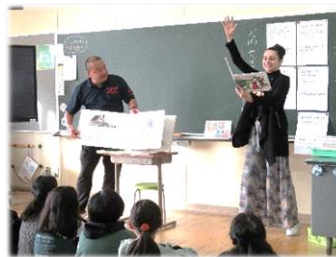
【職員による本の読み聞かせ】