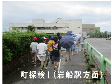
町探検1(岩船駅方面)

7月5日(水)1・2時間目に、2年生が牧目方面に「町たんけん」に行ってきました。1回目は雨の中での岩船駅前方面の探検でした。2回目は、とても良い天気の中、行くことができました。学校を出発して、白山神社、学童、東光寺、九日市農村公園、上野やさんなどに行ってきました。