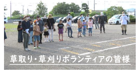
草取り・草刈りボランティアの皆様

7月2日(日)にボランティアによる草刈り、草取りを行いました。当日は60名以上のおうちの方や子どもたちが参加し、エベレスト周辺の草刈りや砂利・中庭の草取りをしていただきました。1時間程度であつという間に刈り(取り)終わりました。子どもたちにとって一番の遊び場所であるエベレストや中庭の整備をしていただき、子どもたちも気持ちよく活動しています。ありがとうございました。