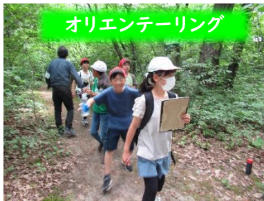
オリエンテーリング