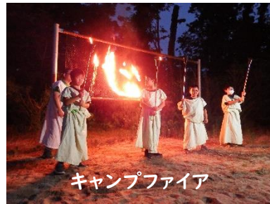
キャンプファイア