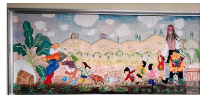
地域の方が描いてくださった教務室前廊下の絵