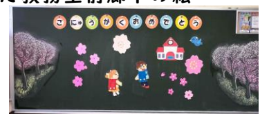
1年生教室の歓迎の絵