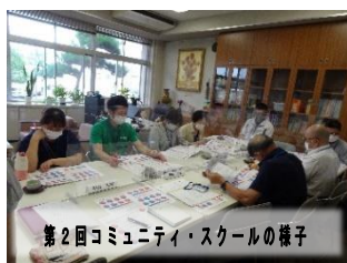
第2回コミュニティ・スクールの様子

学習参観・学年懇談会のあった8日（木）に第2回コミュニティ・スクールも行いました。各学級の学習を参観した後、学校評価についての報告をしたり、今後の学校行事について話し合ったりしました。