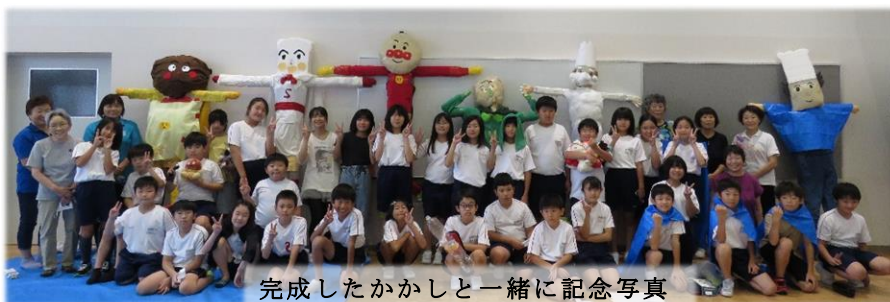
完成したかかしと一緒に記念写真

作業中は、「頭は〇〇ちゃんたちで作って」「足はどうやってくっつける？」などの声が聞かれましたが、どのグループも友達と協力しながらかかしを完成させることができました。今回は『アンパンマン』をモチーフに6体のかかしを作りました。完成したかかしは、桃川にある学校田に設置する予定です。また、学校田には地域の方が作ってくれた看板（右下の写真）も設置する予定です。