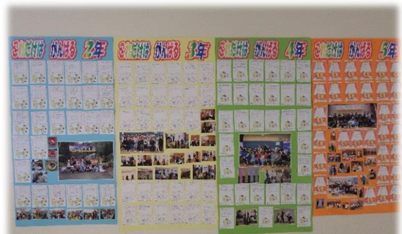
各学年のめあてカード