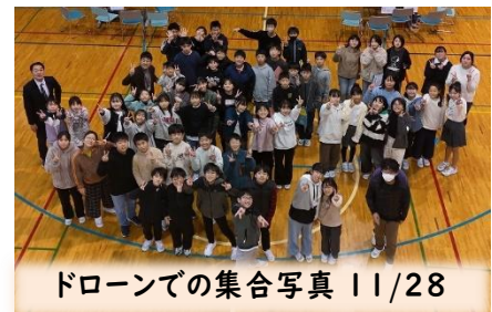
ドローンでの集合写真 11/28

11月27日(水)と28日(木)に、6年生は総合の学習で、地域でお仕事をされている方にお話を聞きました。今年度は、平林小学校を会場に行いました。2日間で参加いただいた事業所数は32。子どもたちは、今まで知らなかった職業に新たに興味をもったり、仕事について理解を深めたりしました。