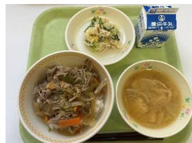
（左手前 村上牛の牛丼）

また、当日は、給食で「村上牛の牛丼」を出され、おいしそうに食べる子どもや職員の姿が見られました。